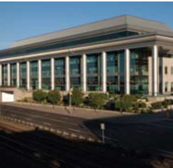
Government Red River Road Government Building Thunder Bay, Ontario Owner: Ontario Ministry of Energy and Infrastructure Manager: Ontario Realty Corporation Architect: Arthur Erickson and Reginald Nalezty