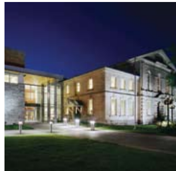
Historical Pembroke Courthouse Pembroke, Ontario Owner: Ontario Realty Corporation Manager: Ontario Realty Corporation Architect: David Clusiau, NORR Limited Architects & Engineers (Renovation)