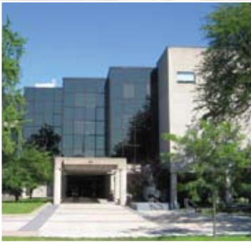
Corporate Robert S. K. Welch Courthouse St. Catharines, Ontario Owner: Ministry of Energy & Infrastructure (MEI) represented by the Ontario Realty Corporation Manager: SNC Lavalin ProFac Inc. Architect: Flemming and Secord Architects