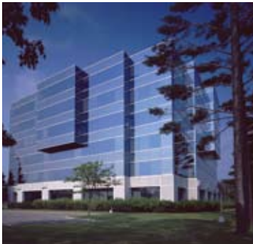
Under 100,000 square feet Hunt Club Crossing Ottawa, Ontario Owner: Investors Group Trust Co. Ltd. Manager: Bentall LP Architect: Grainger Boyle Architects