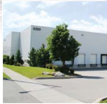
Industrial Kennedy/Kenway Business Park Mississauga, Ontario Owner: bclMC Realty Corporation Manager: GWL Realty Advisors Inc Architect: Akitt+Swanson Architects / Sirlin, Miller & Malek Architects