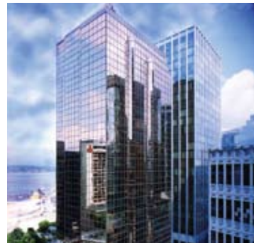
100,000 to 249,999 square feet Manulife Place Vancouver, British Columbia Owner: Manulife Financial Manager: Manulife Financial, Vancouver Real Estate Architect: Stantec Consulting