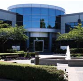
Suburban – Low Rise Crestwood Corporate Centre Richmond, British Columbia Owner: Great West Life Assurance and London Life Insurance Manager: GWL Realty Advisors Inc. Architect: Buntin Coady