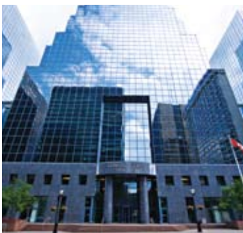
Over 1 million square feet Constitution Square Ottawa, Ontario Owner: CPPIB & Omers Realty Corporation Manager: Oxford Properties Group Architect: Talchinsky and Goodz Architects